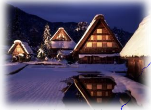
白川郷の點燈活動