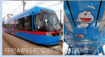
哆啦A夢(小叮噹)路面電車[高岡]