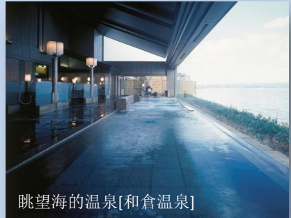
眺望海的溫泉[和倉溫泉]