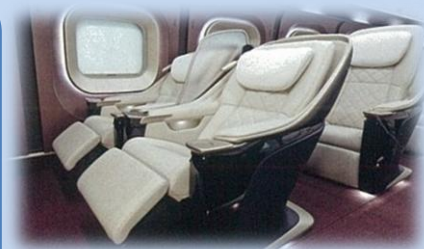
「GranClass豪華車廂」採用真皮坐位