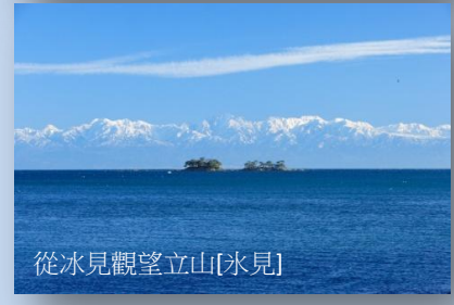
從冰見觀望立山[冰見]