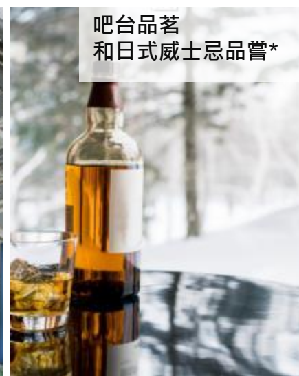
吧台品茗 和日式威士忌品嘗*