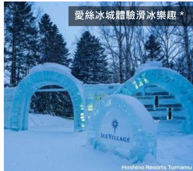
愛絲冰城體驗滑冰樂趣*